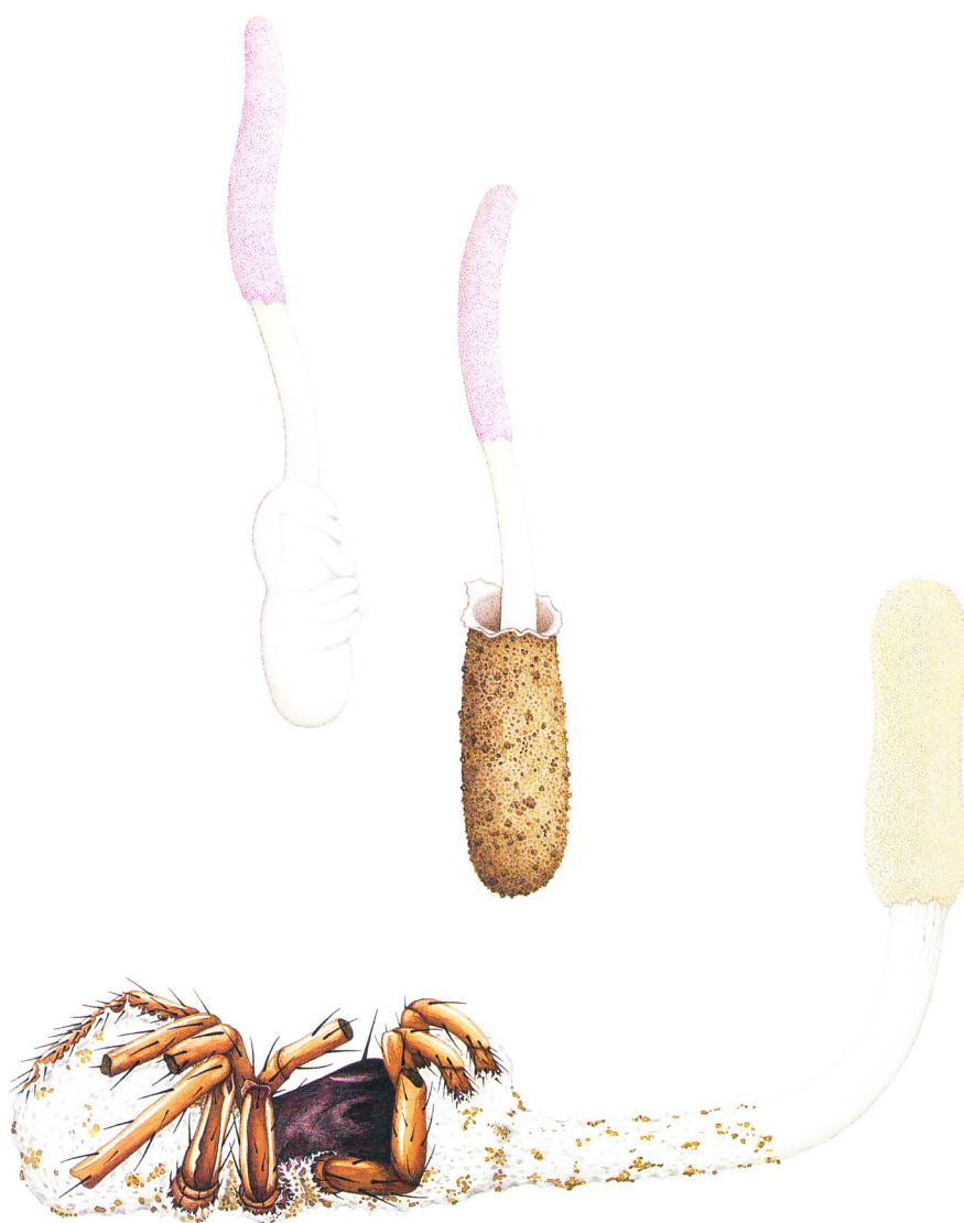
イリオモテクモタケ(下)とそのアナモルフのクモタケ(上)

Purpureocillium atypicola (Yasuda) Spatafora, Hywel-Jones & Luangsa-ard